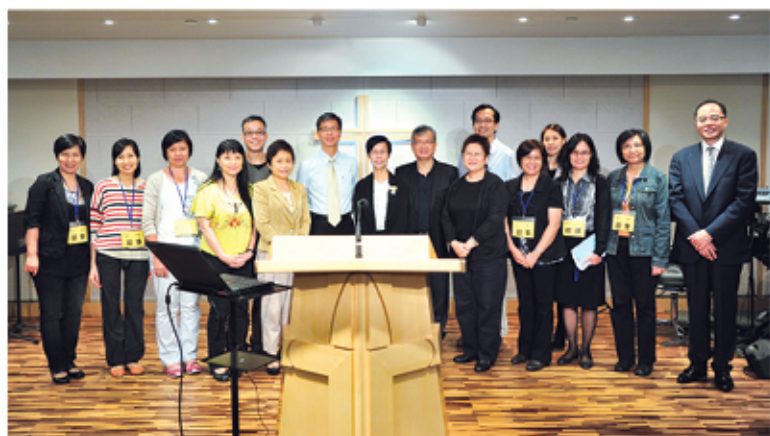
健關講座——「關顧者生命質素與成長」大合照