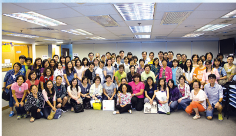
美善人生主日學大會照